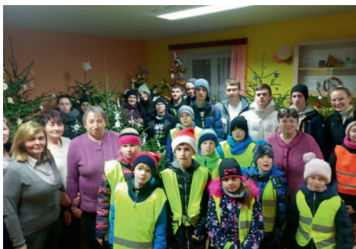
Výstava stroměčků Nové Ransko, str. 2