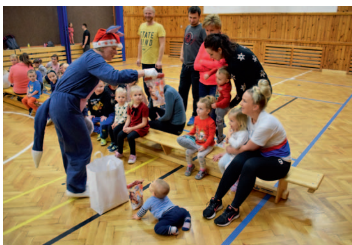
ASPV – Cvičení rodiče a děti, str. 20