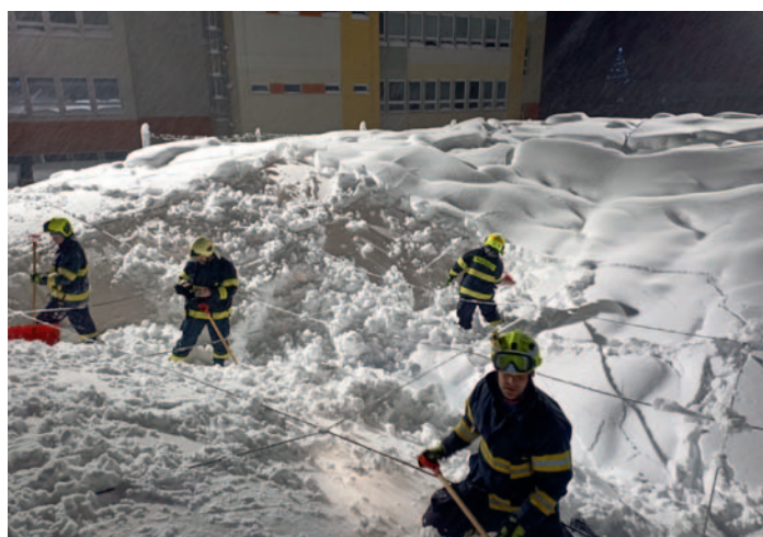
JPO II, str. 18