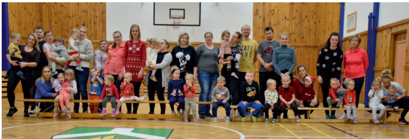
ASPV – Cvičení rodiče a děti, str. 20