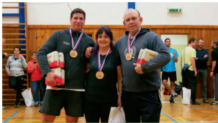
2. místo – Dva +1, tým Praha, str. 20