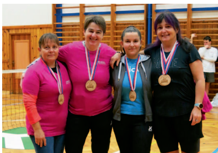
Hráčky Vánočního turnaje, str. 20