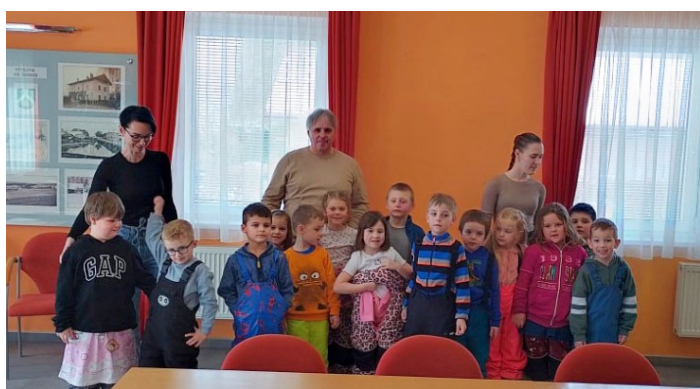
Třída Veverek na návštěvě na městském úřadě