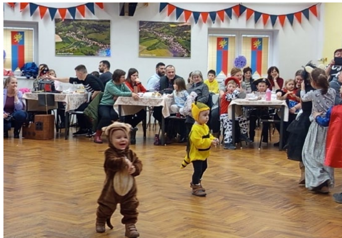
Dětský karneval, str. 1