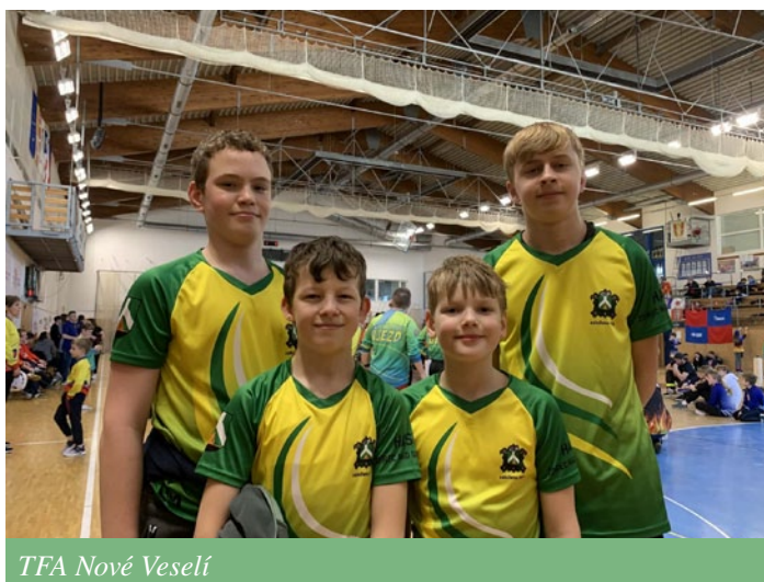
TFA Nové Veselí