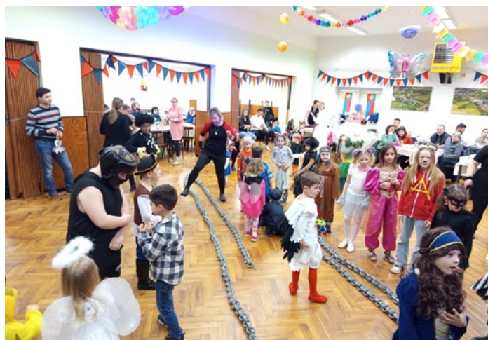
Dětský karneval, str. 1