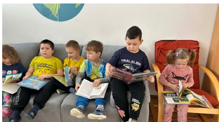
Třída Soviček objevuje kouzla školní knihovny