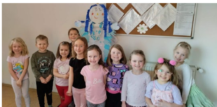
Paní zima Morena vytvořená zájmovým kroužkem Rarášek