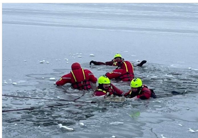
SDH Ždírec nad Doubravou, str. 17