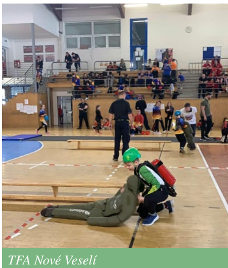
TFA Nové Veselí

V únoru už na děti čekaly první soutěže roku 2026. V sobotu 21. února absolvovala dvě družstva mladých hasičů „Hal.ofku“ v tělocvičně ve Žďáře nad Sázavou. Jednalo se o halovou štafetu o čtyřech úsecích s překážkami: přeskok přes překážku, přeběh kladiny, přenesení hasičího přístroje a spojení útočného vedení. Naše kvarteta obsadila krásné 7. a 15. místo v kategorii starších žáků.