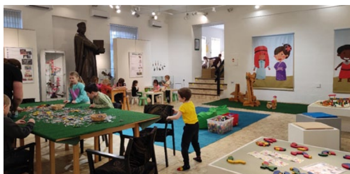
Výstava Hrajeme si v muzeu v Městském muzeu a galerii v Hlinsku