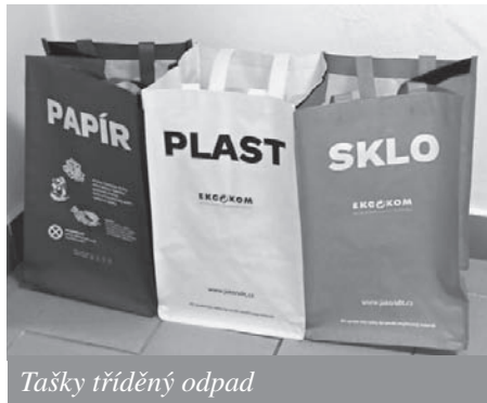
Tašky třídění odpad

Při třídění odpadů prosím sešlápněte obaly tak, aby v nádobách zabíraly co nejméně místa. Do kontejneru se pak vejde více odpadu, který přinesou do kontejne-