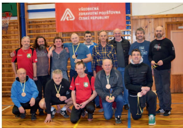
Nohejbal Ždírec n. D. – veteráni, str. 21