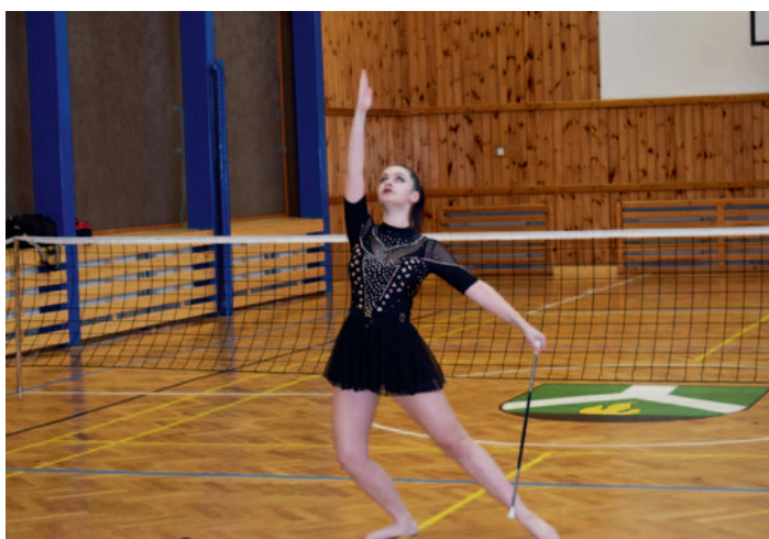
Nohejbal Ždírec n. D. singl twirlerka, str. 21