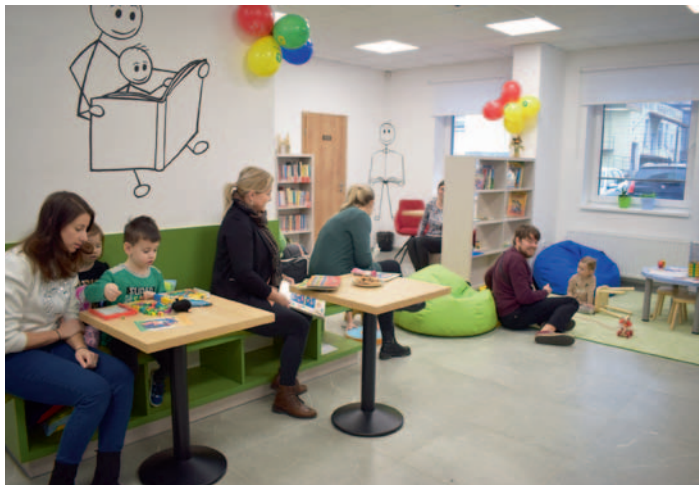
Knihovnické hrátky, str. 2