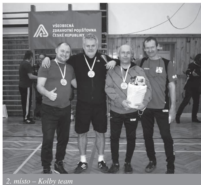
2. místo – Kolby team