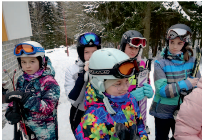
Lyžařský kurz ZŠ, str. 11