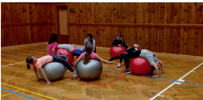
Hodina zákyň ASPV s gymnastickými míči