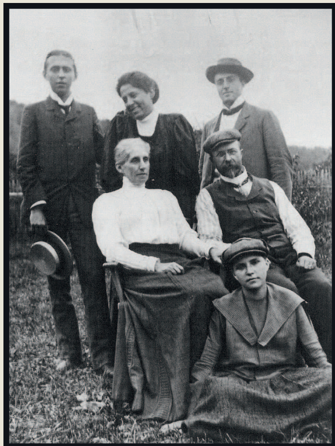
V roce 1906 T. G. Masaryk pobýval s rodinou i v Krucemburku