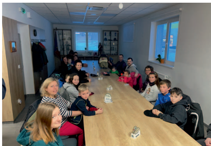
SDH Kohoutov, str. 19