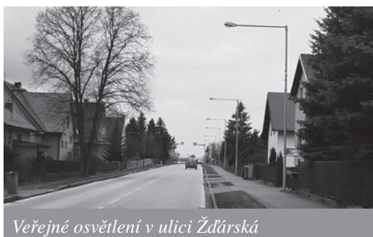
Veřejné osvětlení v ulici Žďárská

V novém stavu je navržen harmonogram stmívání, který bude probíhat ve dvou stupních respektujících zatížení komunikace. Harmonogram stmívání pro ulice např. Brodská, Žďárská, Chrudimská, náměstí 9. května bude od zapnutí veřejného osvětlení do 21 hod a od 5 hod do vypnutí veřejného osvětlení 100% intenzita osvětlení, od 21.00 hod do 5.00 hod 60% intenzita osvětlení. Harmonogram stmívání pro ulice např. Školní, Spojovací, Družstevní, Nad Řekou bude od zapnutí veřejného osvětlení do 21.00 a od 6.00 do vypnutí veřejného osvětlení 100% intenzity osvětlení, od 21.00 hod do 00.00 hod. 60%, od 00.00 do 4.00 hod.