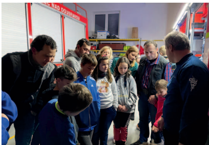
SDH Kohoutov, str. 19