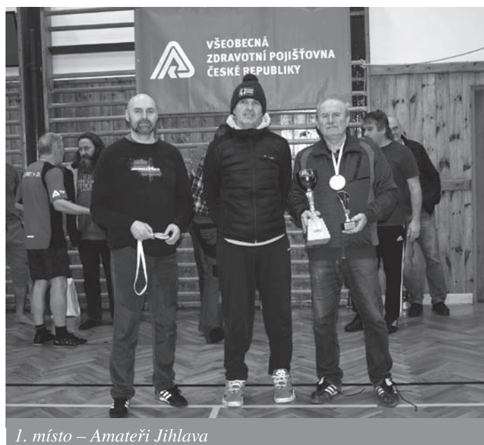
1. místo – Amateři Jihlava