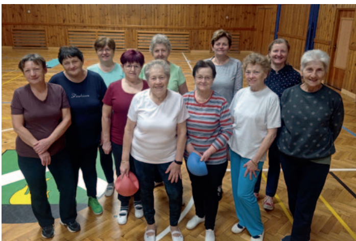
SPV – ženy