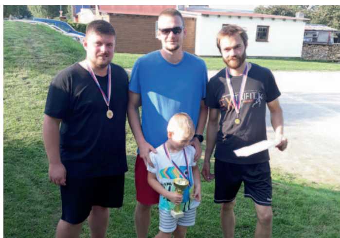
Hlinsko v Čechách – Rváčovská 2021, str. 20