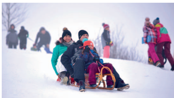
Zimní radovánky ve Ždírci n. D.