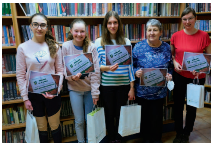
Nejlepší čtenáři roku 2021