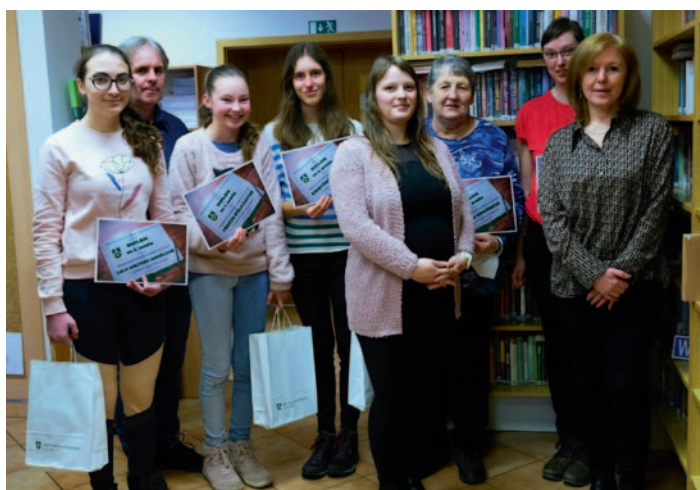
Čtenář roku 2021, str. 1