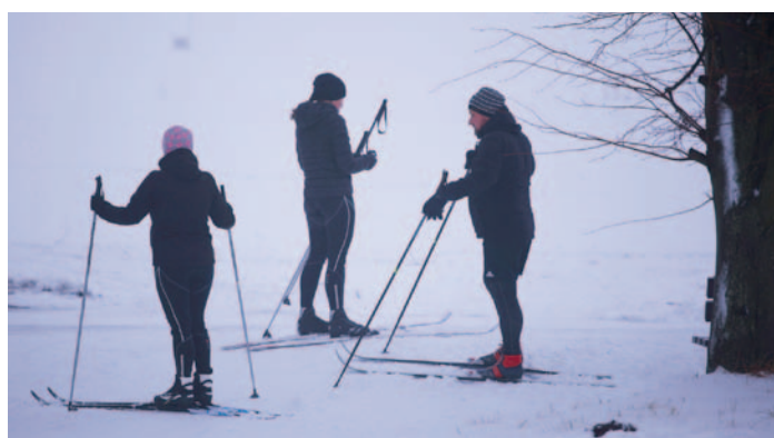
Příznivci běžeckého lyžování ve Ždírci n. D.