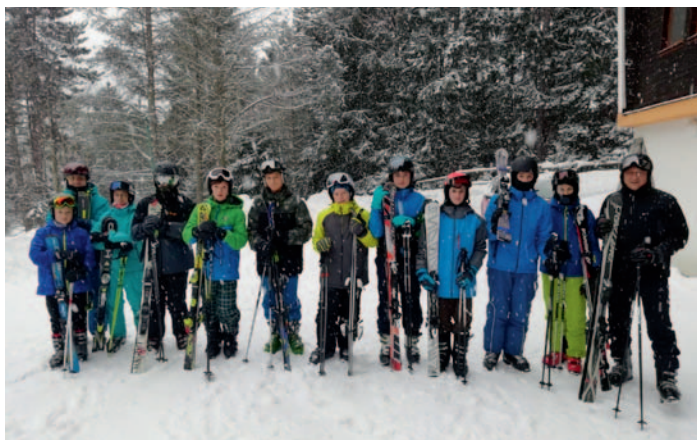
Lyžařský kurz v Karlově pod Pradědem