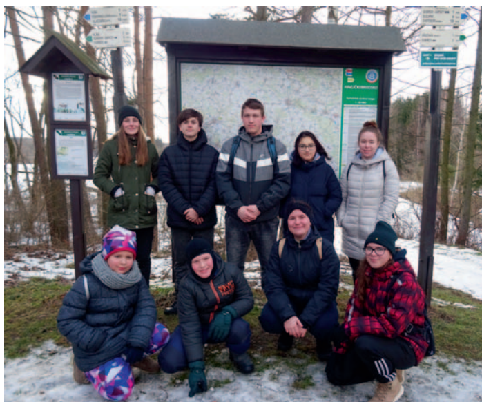
SDH Ždírec n. D. – mladí hasiči, str. 19