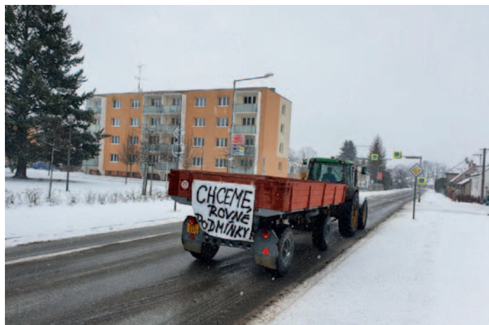
Protestní akce zemědělců, str. 9 a 10