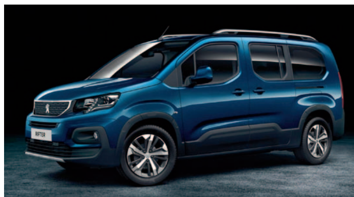
Nový elektromobil pro sociální služby Peugeot Rifter