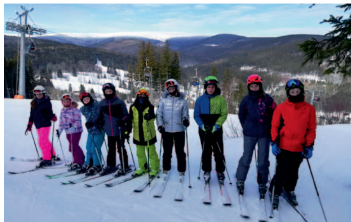
Lyžařský kurz v Karlově pod Pradědem