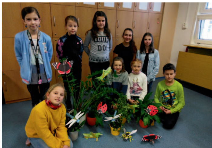
Žáci v přírodovědném kroužku poznávali hmyzí svět