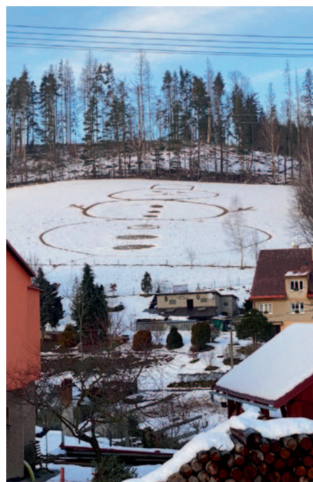
Vyšlapáno ve sněhu, kopec nad Horním Studencem