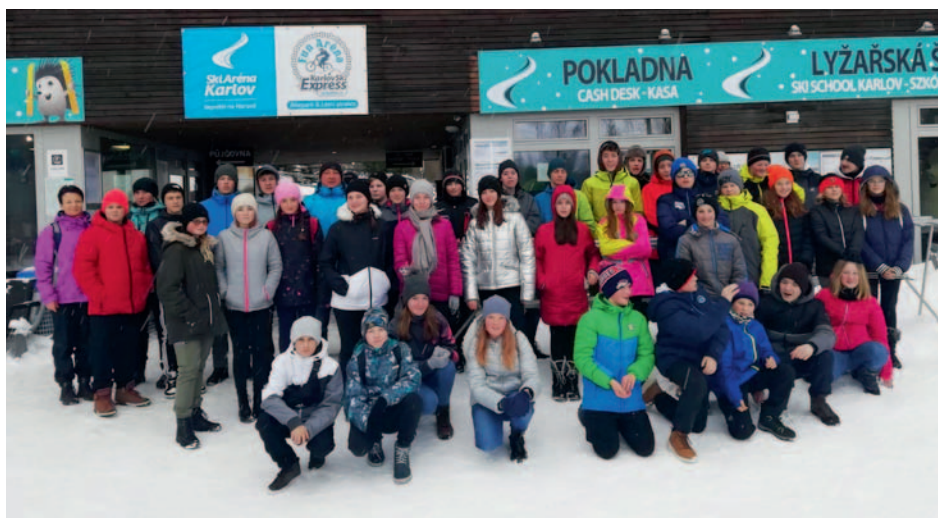
Lyžařský kurz v Karlově pod Pradědem

Také večerní programy si žáci užili, velice aktivně se do nich zapojovali a náležitě se bavili. Dokonce jim ani nechyběly mobilní telefony, které měli možnost využít přibližně hodinu každý večer. Součástí programu byla i jedna večerní venkovní hra, plavání v bazénu a hry v tělocvičně hotelu Kamzík.