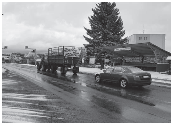
Protestní akce zemědělců