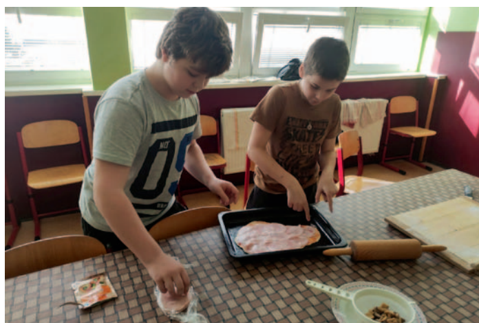
Přírodopis a Výchova ke zdraví ve školní kuchyňce – třída 6. B