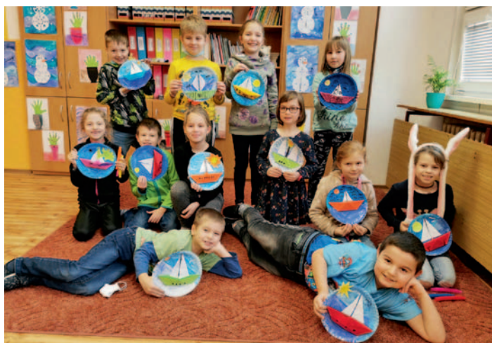
Mořští vlci z 2. B