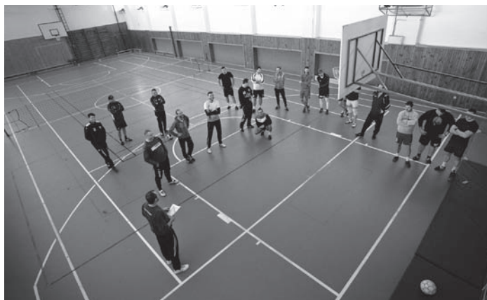
Vrdy – zahájení 21. ročníku turnaje trojic 2021

Stále probíhají pravidelné tréninky v tělocvičně ždírecké školy, ve čtvrtek od 19 hodin.