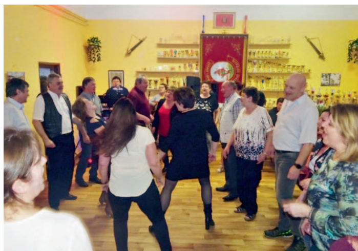
Den žen v Údavech, str. 23