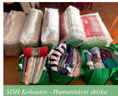
SDH Kohoutov – Humanitární sbírka

SDH Kohoutov se také zúčastnil humanitární sbírky pro Ukrajinu, kdy jsme z vlastních zdrojů nakoupili deky, polštáře, povlečení pro děti i pro dospělé v hodnotě