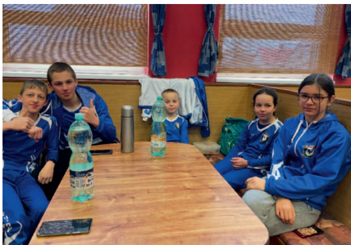
SDH Kohoutov – Hasičské domino, str. 22