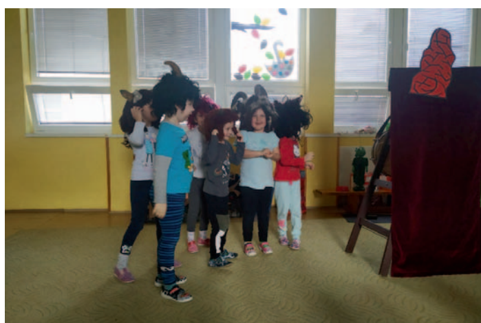
Co se děje ve školce, str. 3