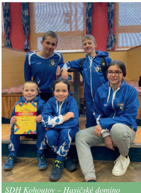
SDH Kohoutov – Hasičské domino