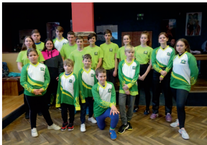
Mladí hasiči SDH Ždírec n. D., str. 22