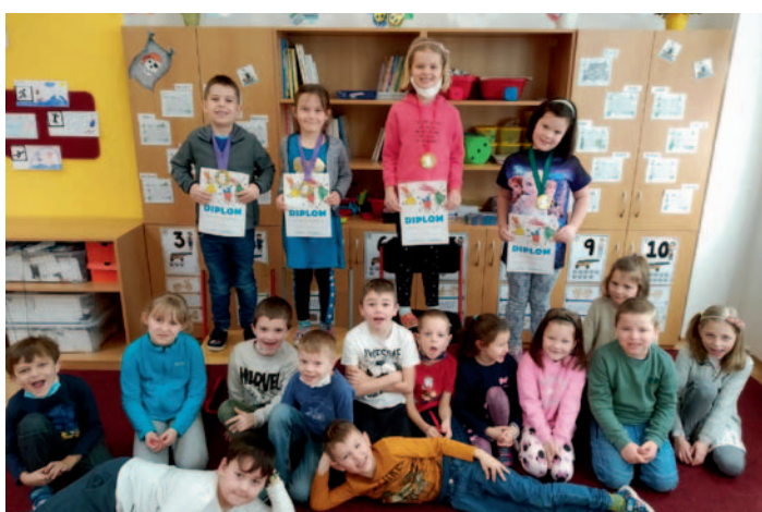
Recitační soutěž, str. 3