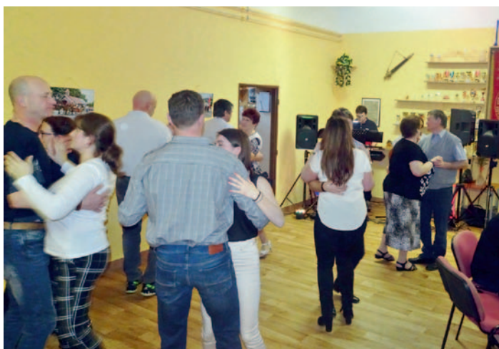
Den žen v Údavech, str. 23