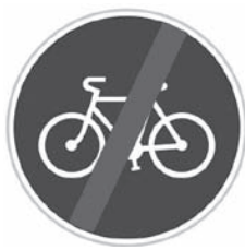
Konec stezky pro cyklisty – C8b