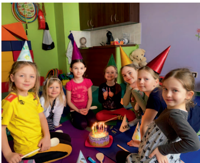
Oslava narozenin jednoho z „jogínků“ v CpR Doubravka