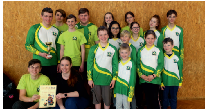
Mladí hasiči – Hlinecké piškvorky

Sbor dobrovolných hasičů Ždírec nad Doubravou pořádá