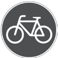
Stezka pro cyklisty – C8a