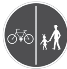
Stezka pro chodce a cyklisty – C10a