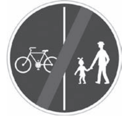
Konec stezky pro chodce a cyklisty – C10b