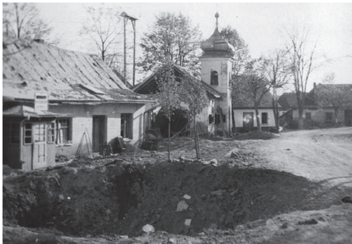
1945 – kráter u zvoničky

Po položení věnce ždíreckými hasiči přednesou několik básní žáci základní školy a s pásmem písní vystoupí pěvecký sbor Doubravan.