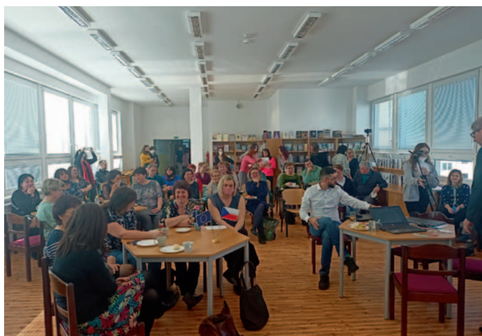
Den s novou informatikou, str. 13