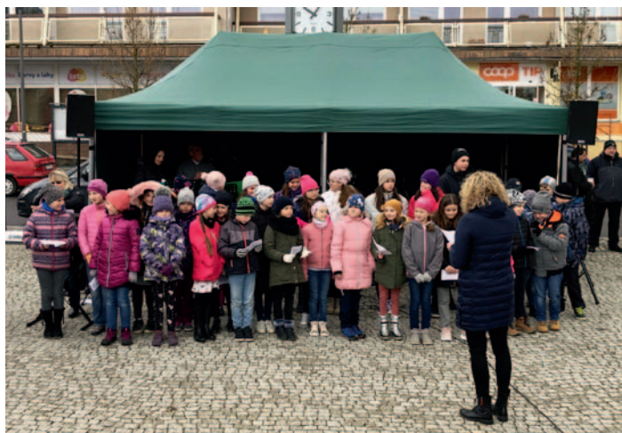
Jarní jarmark, str. 1