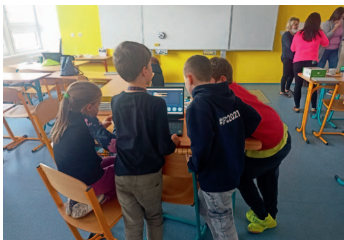
Den s novou informatikou, str. 13