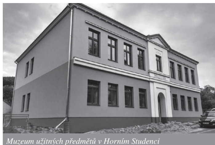
Muzeum užitečných předmětů v Horním Studenci

V přízemí je koupelna se záchodem a prádelna pro užívání správcem objektu. Hygienické zázemí v mezipatře bude sloužit návštěvníkům muzea. Stavební práce provedla firma Ondráček vodo-topo-plyn, Ždírec n. D., která ve veřejné soutěži nabídla nejnižší cenu. Celková cena rekonstrukce sociálního zázemí byla 814 tis. Kč.