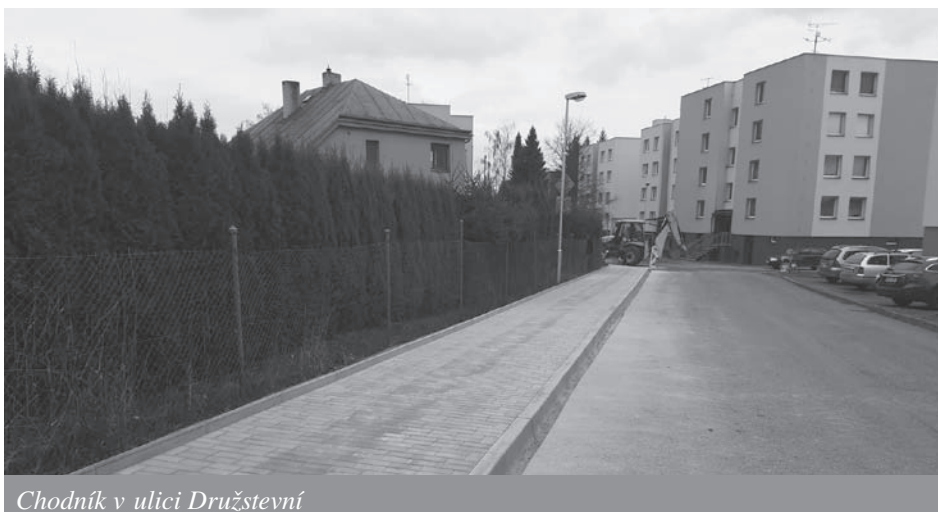
Chodník v ulici Družstevní