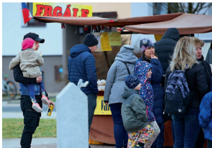
Jarní jarmark, str. 1