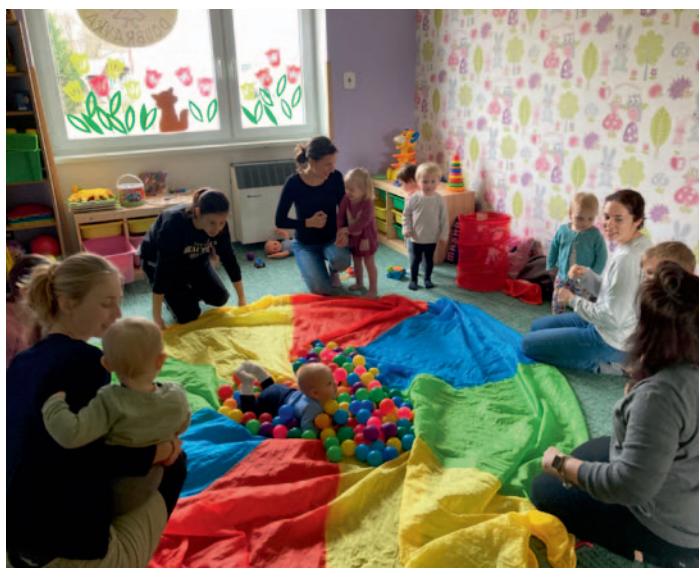
Cvičení dětí a maminek v CpR Doubravka