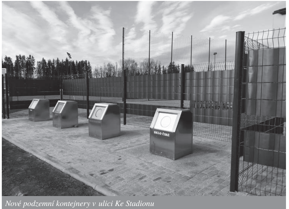
Nové podzemní kontejnery v ulici Ke Stadionu

Stavební práce provedla firma Instav Hlinsko, a.s., která ve veřejné soutěži nabídla nejnižší cenu. Celková cena výstavby podzemních kontejnerů byla 2,02 mil. Kč. Město na tuto akci dostalo dotaci ve výši 1,2 mil. Kč z Ministerstva životního prostředí z Operačního programu životního prostředí.