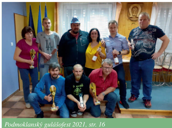
Podmoklanský gulášofest 2021, str. 16