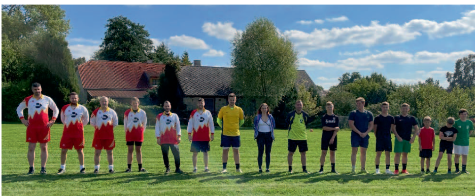
SDH Kohoutov – Fotbalový zápas svobodní vs. ženatí