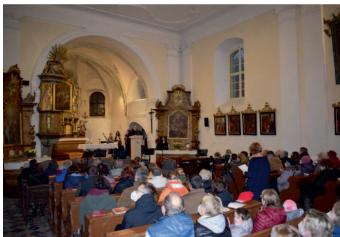
Vánoční koncert v kostele sv. Václava, str.2