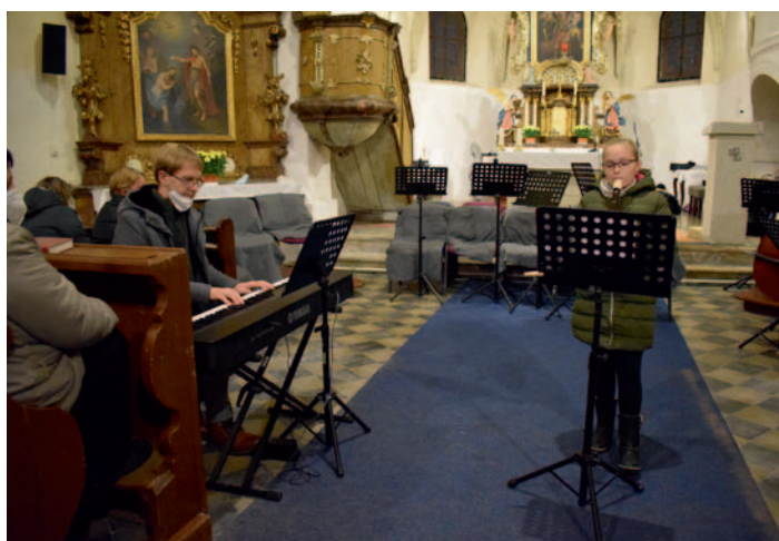
Vánoční koncert v kostele sv. Václava, str.2