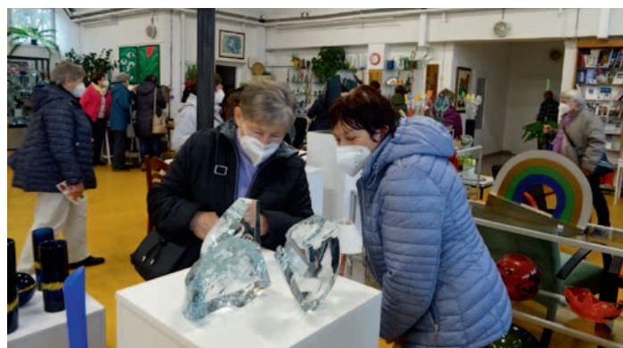
Senioři v galerii skla