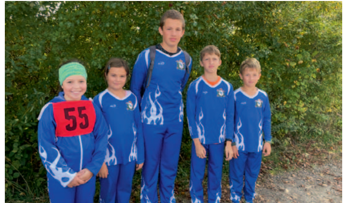
SDH Kohoutov, Běh ZPV ve Žďrci n. D., str. 4