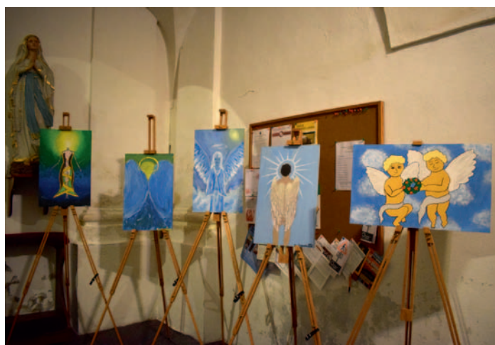
Výstava výtvarných prací ZUŠ Chotěboř, str. 2

Naše noviny – periodický tisk územního samosprávného celku. Měsíčník občanů Ždírec nad Doubravou a místních částí. Vydává Město Ždírec nad Doubravou, Školní 500, 582 63 Ždírec nad Doubravou, IČ: 00268542. Redakční rada: Anna Horáková (hlavní jazyková korektura), Jana Uchytilová, Dana Vavroušková, Ing. Nela Niklová (počítačový přepis, inzeráty). Předseda: Zdena Lédlová (počítačový přepis). Podepsané články vyjadřují názory autorů a nemusí být totožné se stanoviskem redakce a vydavatele. Redakční rada si vyhrazuje právo příspěvky krátiť a upravovat, tiskové chyby vyhrazeny. Adresa redakce: MÚ Ždírec n. D., Školní 500, 582 63 Ždírec n. D., tel.: 569 694 620, e-mail: knihovna@zdirec.cz; mesto@zdirec.cz. Elektronický archiv NN: http://www.zdirec.cz/ . Evidenční číslo MK ČR E 22668. Náklad 1340 výtisků. Grafická úprava, sazba a tisk Unipress Žďár n. S.