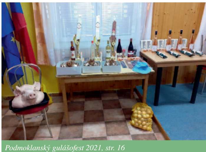
Podmoklanský gulášofest 2021, str. 16