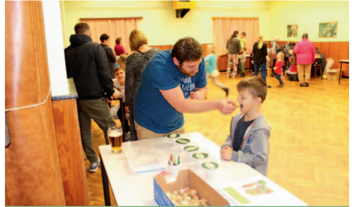
Dětské odpoledne v Horním Studenci, str. 17