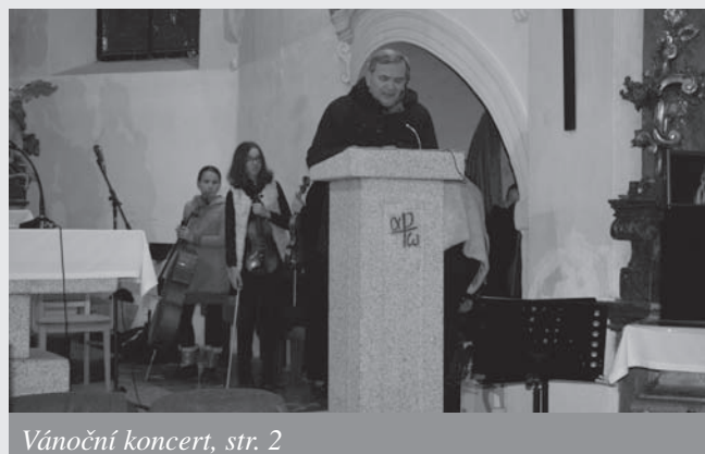
Vánoční koncert, str. 2