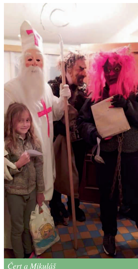
Čert a Mikuláš