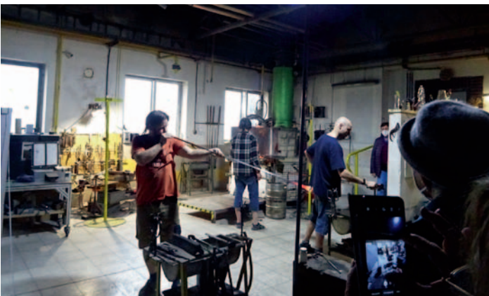
Skláři v Karlově, str. 2