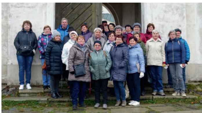
Senioři na výletě na Zelené hoře