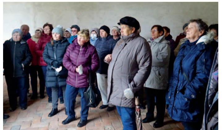
Senioři na Zelené Hoře, str. 2