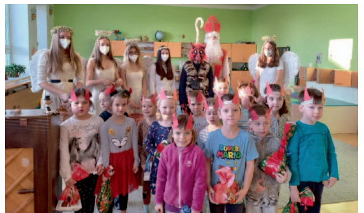
Čertovská nadílka v MŠ