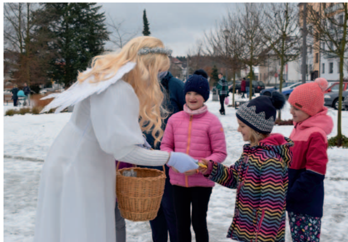
Spanilá jízda sv. Mikuláše, str. 1