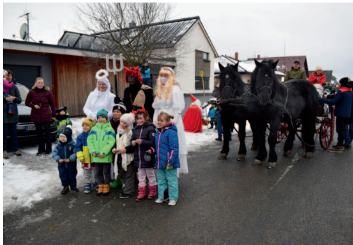
Spanilá jízda sv. Mikuláše, str. 1