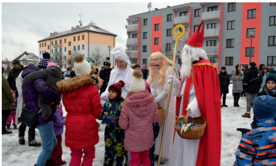
Spanilá jízda sv. Mikuláše