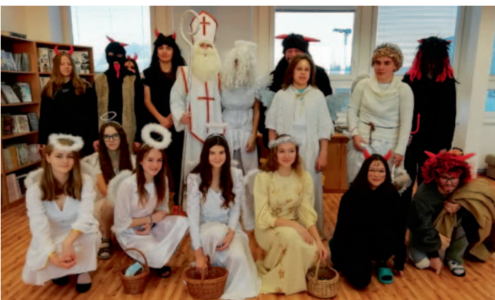
Čertovská nadílka třídy 9.B