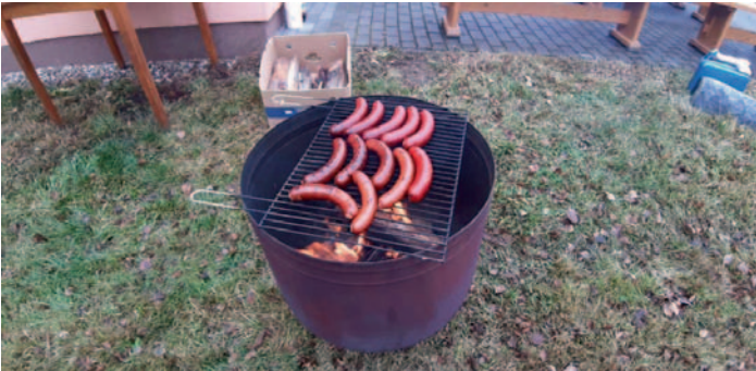
Podzimní brigáda v Novém Ransku, str. 3