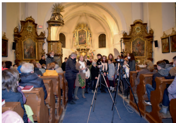
Vánoční koncert v kostele sv. Václava, str.2