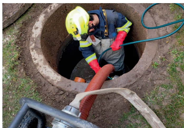
JPO II, str. 16