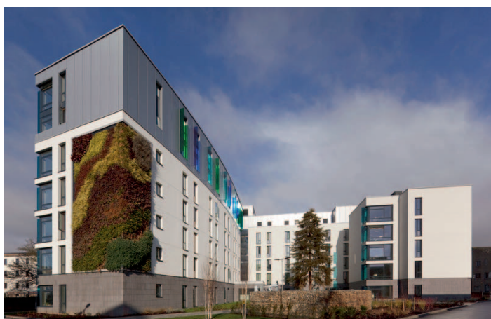
využití CLT panelu