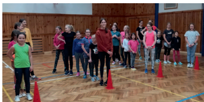
SPV – Předvánoční cvičení žákyň