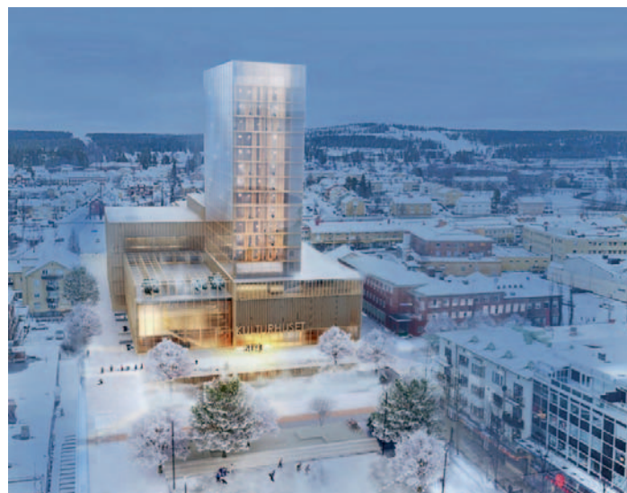
využití CLT panelu