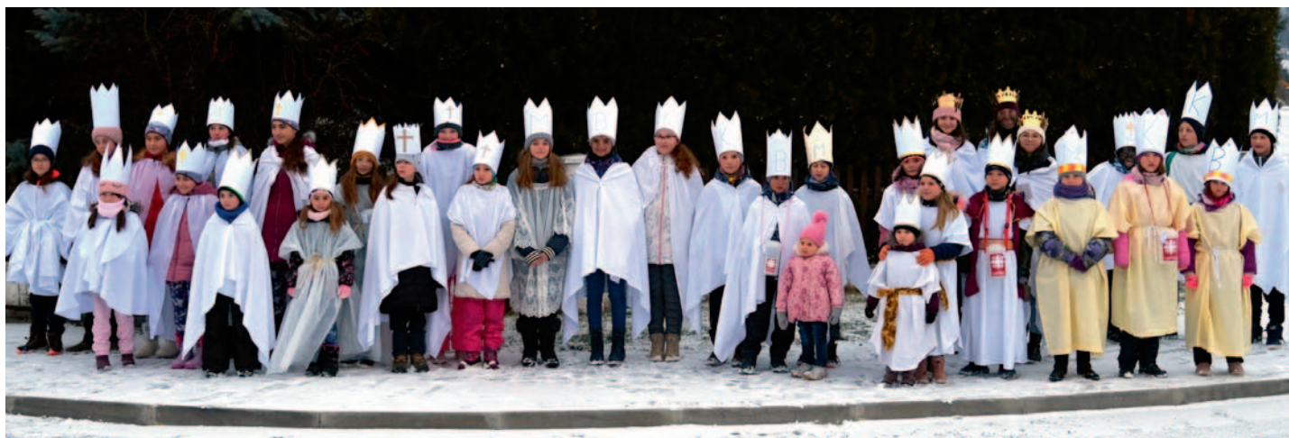
Tříkrálová sbírka, str. 1