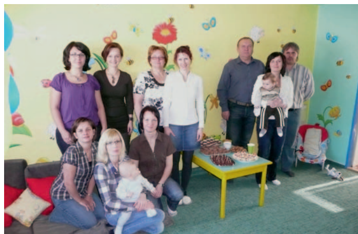
Otevření CpRD v roce 2012