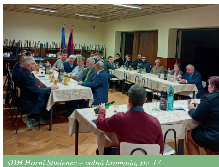
SDH Horní Studenec – valná hromada, str. 17