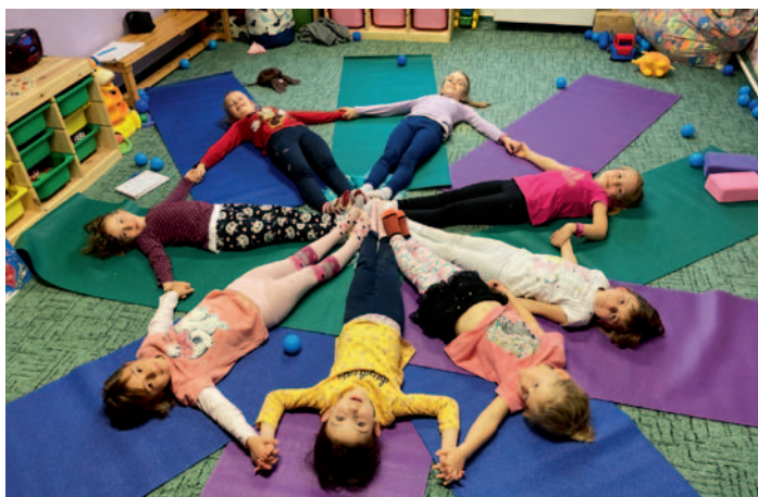
CpRD – ukázka z kroužku dětské jógy