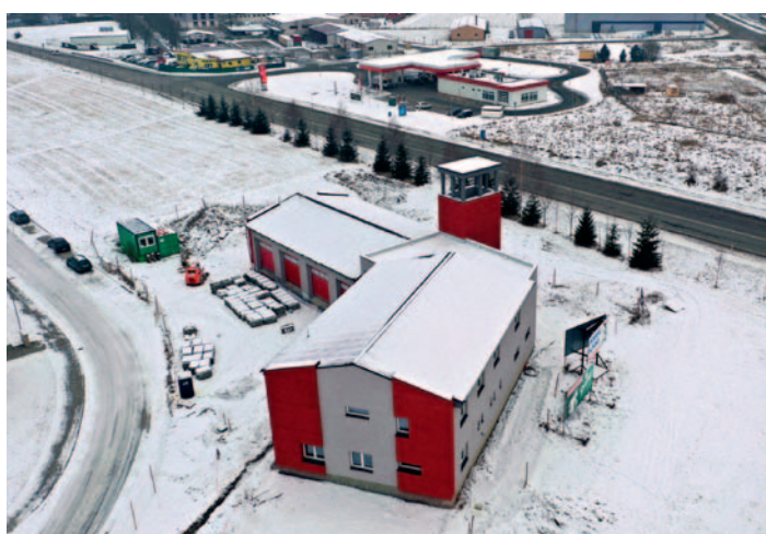
Výstavba nové hasičárny v ulici U Pikulky