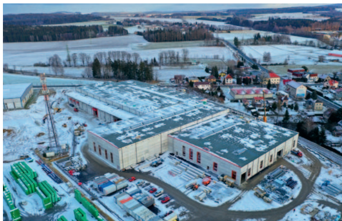
Pokračující výstavba výrobní haly Stora Enso

CLT panely, které se z nového žďíreckého