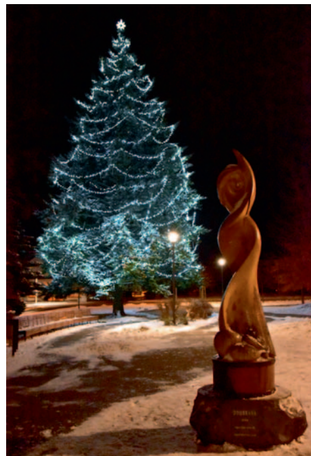
Vítězný ždírecký vánoční strom z on-line hlasování

EVROPSKÁ UNIE Evropský fond pro regionální rozvoj Integrovaný regionální operační program