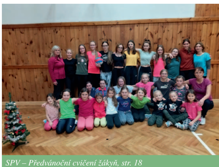
SPV – Předvánoční cvičení žákyň, str. 18